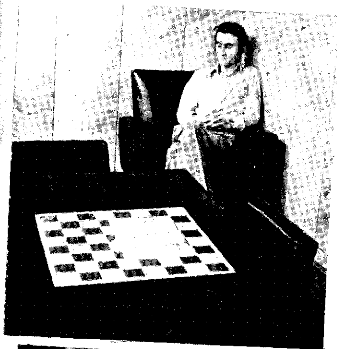
Steane espera Gheorghiu