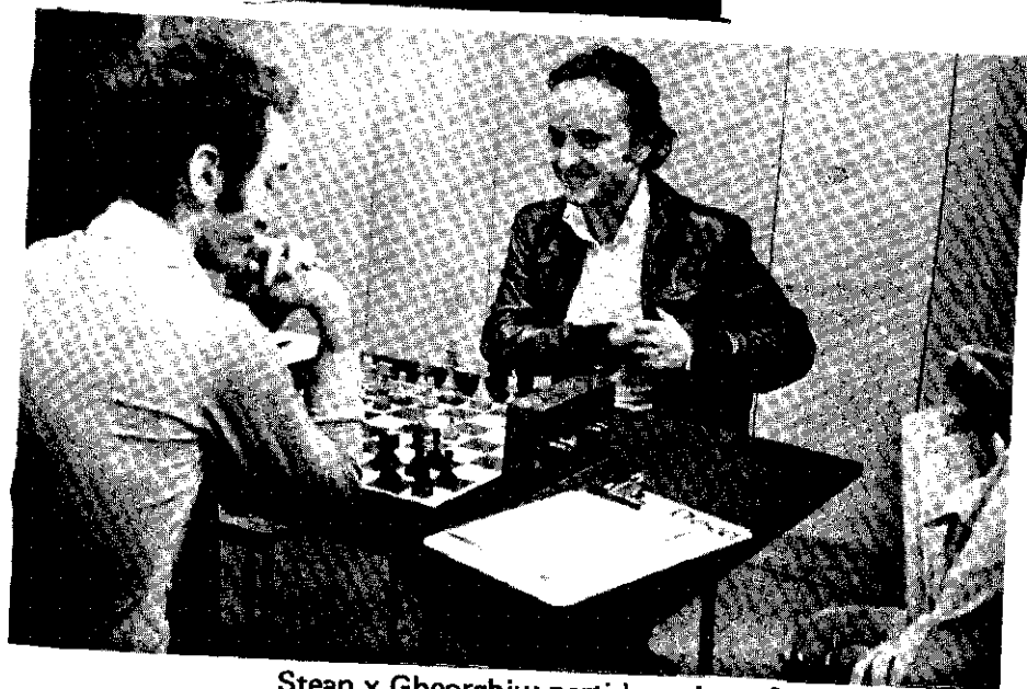
Steane x Gheorghiu: partida amistosa?